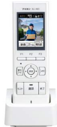
WP-24A(モニター付親機、モニター付ワイヤレス子機、充電台、カメラ付玄関子機のセット)